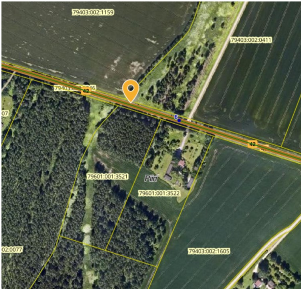
Joonis 2. Riigitee nr 42 Kärkna-Kobratu tee km 5,905

Rita Žereen 5120275, Rita.Zereen@transpordiamet.ee